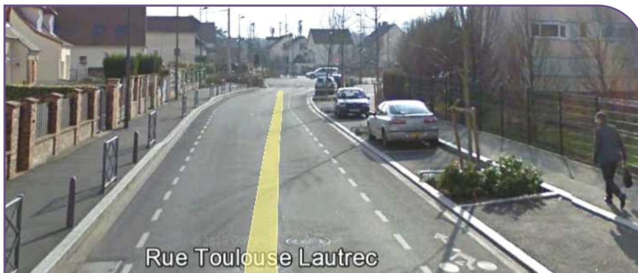
Chaussée à voie centrale banalisée ou Chaucidou de la rue Toulouse Lautrec, largeur de l'aménagement 1,5 m

D'ici la fin d'année 2015 : la ville offrira 33 kilomètres d'itinéraires cyclables.