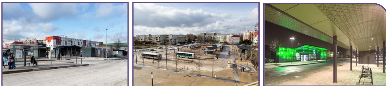
Illustrations du pôle de Sevrans Beaudottes après le réaménagement

Lancé en 2004, le projet a connu de multiples obstacles qui ont porté la réception des travaux 10 ans plus tard, fin 2014.