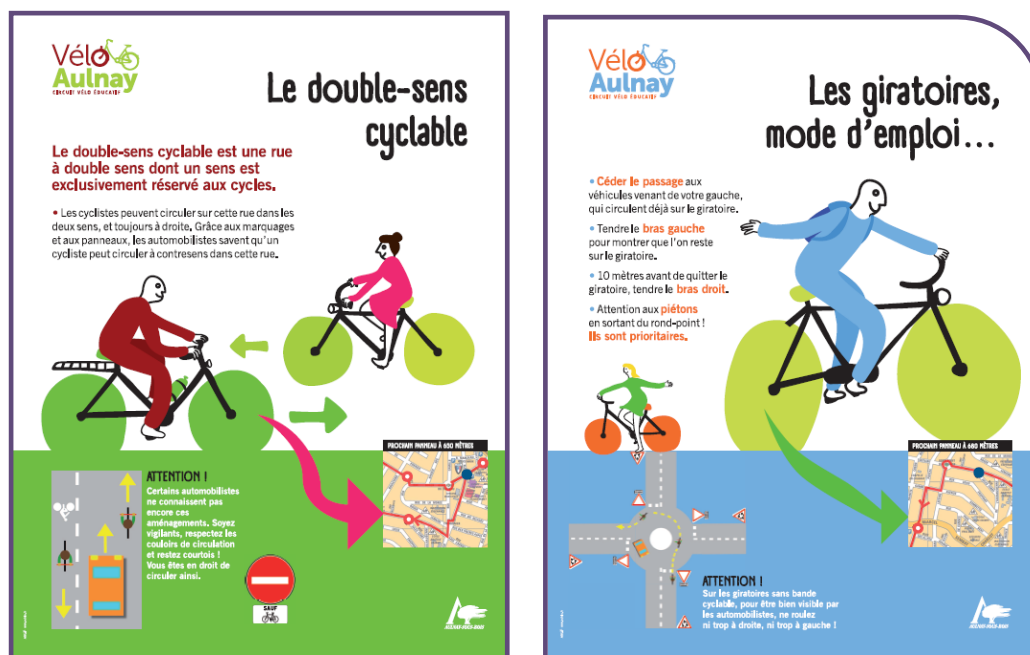
Exemples de panneaux : le double-sens cyclable et le mode d'emploi des giratoires

Les panneaux d'informations sont permanents et ont été installés aux intersections. Ils abordent plusieurs thématiques comportant des explications et illustrations. Le circuit permet ainsi de se confronter aux principales situations rencontrées en circulation : le double sens cyclable, le giratoire, le sas cyclable, les intersections (stop et Cédez-le-passage), la zone 30 et la zone de rencontre, le tourner à gauche, les pistes et les bandes cyclables, les sentes et aires piétonnes.