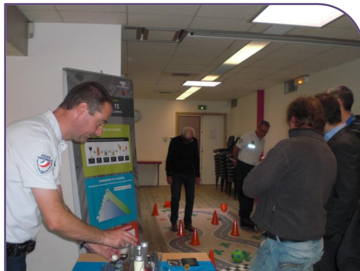
Evènement sécurité routière organisé au parc de Bellevues