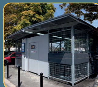
Espace Véligo en gare d'Épinay-Villetaneuse