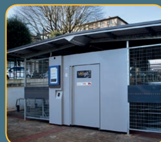
Espace Véligo en gare de Meudon