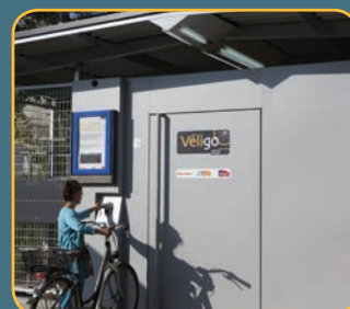
Espace Véligo en gare de Sartrouville