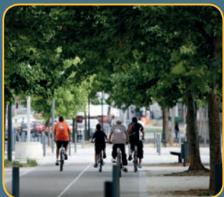
Piste cyclable en Île-de-France