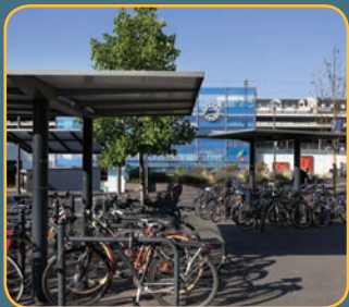
Abris en accès libre – Gare de Houilles – Carrières-sur-Seine