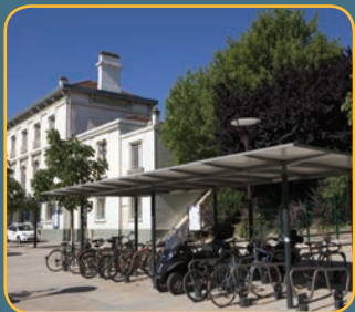
Abris en accès libre – Gare de Brétigny