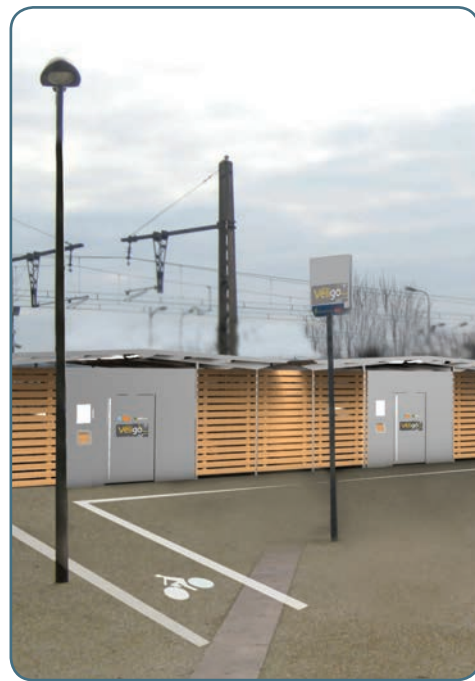
Projet d'abri et d'espace Véligo à Fontainebleau