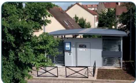
Espace Véligo en gare de Trappes

Conjugué à des aménagements de voirie spécifiques, le stationnement vélo doit garantir aux usagers des conditions d'accès aux gares plus