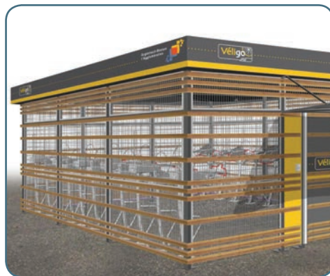
Projet d'espace Véligo au terminus du tramway Pont de Bezons

Si les résultats de l'expérimentation s'avèrent concluants, le déploiement sur un nombre conséquent de gares sera engagé dès 2013 avec l'ensemble des maîtres d'ouvrages candidats. La SNCF prévoit notamment de poursuivre le déploiement avec l'aménagement d'espaces sécurisés sur près de 80 sites.