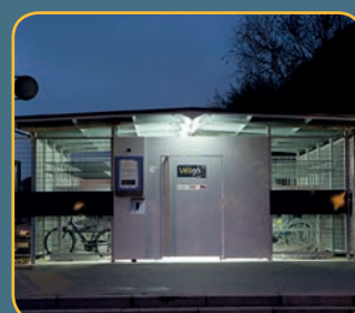
Espace Véligo en gare de Saint-Denis