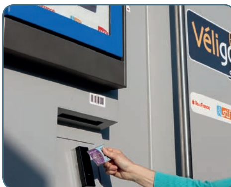
Espace Véligo en gare de Sartrouville

fiables, sécurisées et identifiables. Véligo propose pour cela deux types de stationnement :